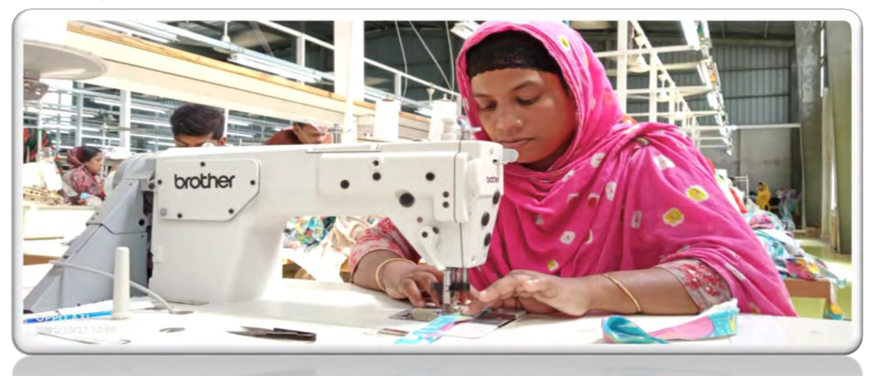
Page 14 of 18

এঃড় ধংংরংঃ ড়িৎ শবৎং ভরহক্পরধযুষ রহ ঃযবরৎ বস বৎমবহপু, ই অঝাউ যধং পৎবধঃবফ ধ ভঁ হফ যিরপ য বী ঃবহফং রহঃরৎবংঃ-ভল্লব ষড়ধহত চরপশ উৎড়া ঢ়ৎড়মৎধয় রং রহ ৣড়ফঁপ বফ ভড়ৎধষযড়িৎ শবৎং ঃড় বহংঁৎব পড়সভড়ৎঃধনষব য়ঁরপশ লড়ঁৎহব ভল্ডস যড়সব ঃড় ড়িৎ শাঢ়ফ্ধপৰ ধহফ ারপব াব ৎংধ. ঋড়ৎ ঃযব বহঃবৎঃধরহস বহঃ ড়ভড়িৎ শবৎং ধহফ ঃযবরৎ ভঞ্চার যু, ই অঝাউ ধৎৎধহম বং বাব হু বধৎ বহঃবৎঃধরহস বহঃ ঢ়ৎড়মৎধসং যক্কাব ঐঅ ঘউ ত টঃংযধ ন ভড়ৎধষষ ঃযব ড়িৎ শবৎং, উী বপঁঃর াব ং উধূ, ঋধসর যু উধু, ঈ ধসঢ় ঙঁঃ, চরপহরপ, গবু নধহ (ধ ষড়পক্ষ পঁষঃঁৎধ ষ ভক্ধংঃ জ্বংগ্রাধ ষ) ক্তপ.