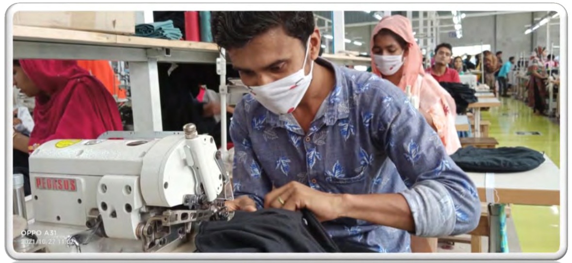
Page 13 of 18

ঐঅ ঘউত পড়হংপরড়ঁংযু ট়ঁঃং বভজ্জ ২ঃড় বসঢ়ড়বি ৭ ড়ি সধহ হড়ঃ ড়হয়ু নুলঁংঃ ৎবপংঁরঃ রহম সড়ৎব ড়িসব হ রহ ড়িৎ শভড়ম্বন, ৎধঃযবৎ নুঁহফবৎঃধশরহম ংড়সব ধংংবৎ ঃর ব ঢ়ৎড়মৎধসং ঃড় ঃৎধরহ্ ঢ়ৎড়সড়ঃ ব ড়িসব হ রহ ঃযব যরমযবৎ স্কাব যং.